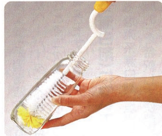
先まで植毛されているので、びん底の汚れを残さず落とせるほ乳瓶用ブラシ。

創業者である社長は、大手の歯ブラシメーカーから独立して当社を設立しました。モノ作り、道具作り