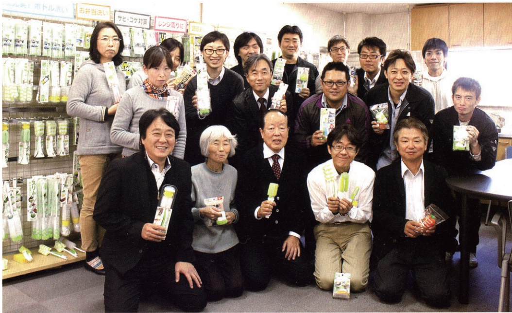
本社展示室には、社員の皆さんがアイデアを出し合って生まれた特長のあるブラシが並んでいます。