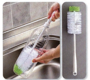
「ボトル洗い」 大容量のペットボトルやステンレスボトルを傷付けずにムラなく洗えます。

今まで通りこだわりの持ち、お客さんのニーズにもお応えできるオンリーワン製品で、さらに売上をのばし、「一人前の会社」と思われるようにしたいです。海外に向けても日本の洗浄用品、ひいては「きれいな文化」というものをもっと発信していきたいですね。あとは、製品開発に活かせるリアルなキッチンスタジオを社内につくりたいという夢もあります。(笑)