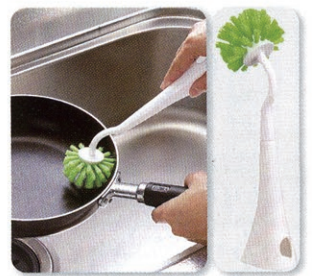
「鍋・フライパン洗い」 立て置きできるなど、収納にも気配りされています。